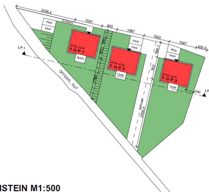
LAGEPLAN LANGENSTEIN M1:500